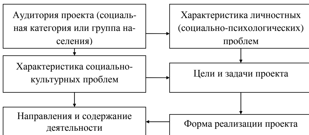
Схема разработки целевого проекта второго типа:

В технологии разработки проектов (особенно второго типа) весьма существенным является четкое определение аудитории проекта и ее соответствующая характеристика. Как показывает опыт, процесс и результат проектирования гораздо продуктивнее в том случае, если мы не опрашиваем абстрактную «аудиторию», а изначально знаем типичные проблемы, потребности и интересы устойчивых социальных групп и социально-культурных общностей, умеем использовать эту информацию при разработке и реализации социально-культурных программ.