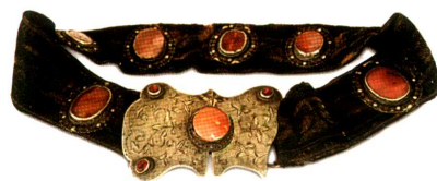
Кэмэр — пояс. Ткань — ковровое плетение, медь — чеканка, сердолик — шлифовка. 2-я половина XIX в.