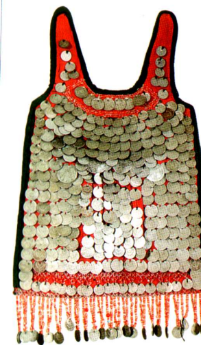
Яга — женское нагрудное украшение. Ткань, кораллы, металл. Середина XX в.

Административное формирование Челябинской области началось в XVII веке. Петр I, проводя политику по развитию производительных сил России и расширению ее границ, явился инициатором проекта Оренбургской экспедиции. Начало экспедиции относится к 1734 году. Возглавил ее выдающийся русский ученый, географ и картограф И.К. Кирилов. В процессе экспедиции был заложенны станции-крепости, которые размещались цепью, как правило, на расстоянии суточной верховой езды друг от друга. В 1736 году в этой цепи отрядом полковника А. Тевкелева были заложены Миасская (в настоящее время село Миасское), Чебаркульская и Челябинская крепости. В августе 1737 года по представлению видного государственного деятеля, историка и географа В.Н. Татищева, возглавившего к тому времени Оренбургскую экспедицию, была органи-