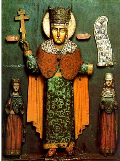
Параскева Пятница. Пермская деревянная скульптура. XVII в. с. Ныроб

Таков образ святого в работе резчика из села Покча, в котором А.В. Луначарский видел «... шедевр «экспрессионистской» скульптуры, имеющей в себе какую-то высокохудожественную манеру».