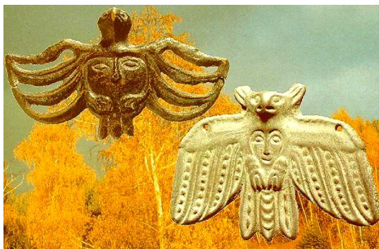
Пермский звериный стиль

Большая часть коллекций Пермской галереи собрана на севере Пермской области. В южной части были найдены лишь редкие памятники. Это обстоятельство связано, очевидно, с более ранним освоением Севера русскими посе­ленцами, с более ранним укоренением здесь русской культуры. Первая известная нам русская крепость на северной Каме — Анфаловский городок — основана новгородским воеводой, перешедшим на московскую службу, Анфалом Никитиным между 1340 и 1398 го­дом. В начале XV века вологодцы Калининковы начали добычу соли на реке Боровой, в 1430 году перенесли промыслы на Усолку, основав город Соликамск, вто-