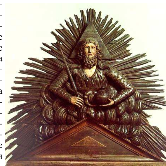
Саваоф XVIII в.

Формирование мариюцкого населения на Урале происходило с конца XVI века, когда из Среднего Поволжья за пределы коренной этнической территории мигрировали луговые мариюцы. Они относятся к группе позд-