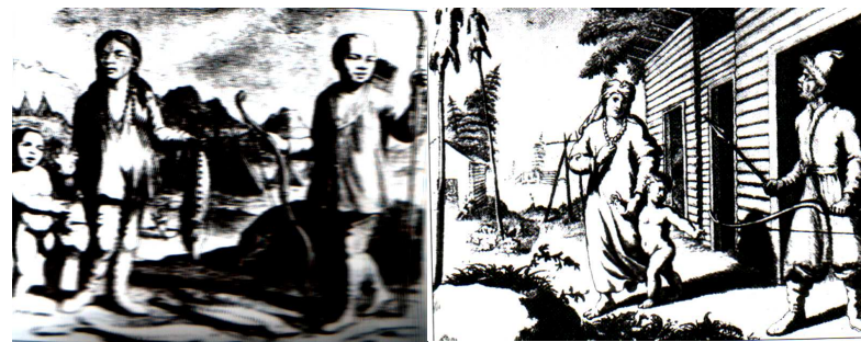
Ханты (остяки). Гравюра начала XVIII в.

Большинство божеств, которым с глубокой древности поклоняются манси и ханты, являются персонифицированными объектами и явлениями природы и связаны с хозяйственной деятельностью людей. Так как люди представляют себе жизнь богов похожей на свою, то в священный дом (сумь-ях) вместе с богом часто поме-