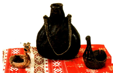
Ижау — ковши, дерево. Начало XX в. Муртай — фляга, кожа. Середина XIX в.

Украшения, одежда, предметы быта, орудия труда — бесценные исторические свидетельства, рассказывающие о самобытной национальной культуре башкир.