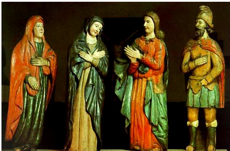
«Группа предстоящих» XVIII в. г. Соликамск

ход к статуарности. Креста нет, он не сохранился, но ощущение висящего на кресте мертвого тела создается подчеркнутой плоскостью фигуры, хрупкостью рук, бессилием упавшей на плечо головы. Это распятие, поражающее тонкостью и изяществом очертаний, наполнено пронзительным, высоким трагизмом.