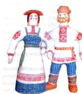
Коми-пермяки в национальных костюмах

Русская православная церковь неустанно боролась со всеми проявлениями язычества. Но религиозные традиции коми-пермяков были настолько сильны, что церкви приходилось идти на компромисс. Возможно именно этому обязан своим появлением феномен распространения знаменитой пермской деревянной скульптуры. Пермяки иногда предпочитали их иконам, в которых преобладала церковная каноничность.