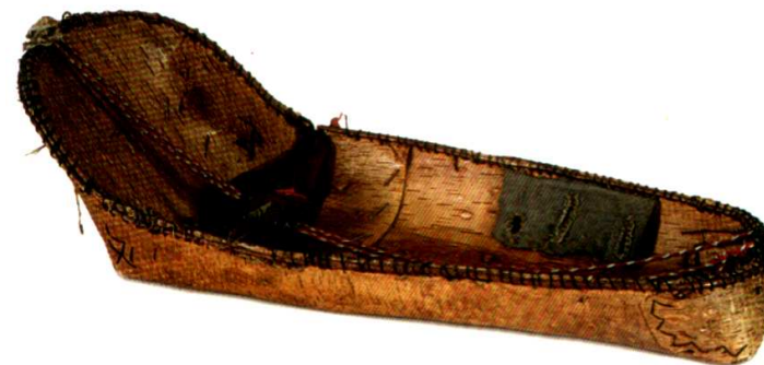
Бешек — колыбель. Береста. 2-я половина XIX в.

Большой гордостью богатых башкир были когда-то и ковровые пояса — кэмэр. Сами башкиры их не изготавливали, а покупали, причем такой пояс ценился очень дорого: за него давали хорошего породистого скакуна или пару коней. Пояс действительно хорош: яркая ткань тонкой искусной работы, медная или серебряная пряжка с гравировкой, дорогие бляхи с чеканным узором, в которые вставлены отшлифованные полудрагоценные камни: агат, сердолик, бирюза. Такие пояса в начале XX века сохранились в немногих местах за Уралом как вещь старинная и редкая. В коллекции Челябинского музея такой пояс есть.