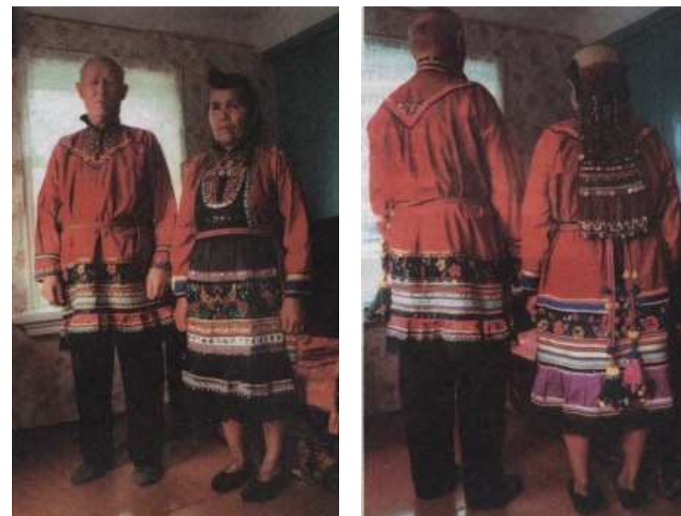
Национальные марийские костюмы

Слово «манси», как и «ханты», в переводе означает «человек». Когда русские впервые столкнулись с манси и хантами, они не различали эти два народа и в источ­никах XII века их называли «югрой». Позднее, прибли­зительно с XIV века, русские переняли коми-зырянское название манси — «вогулы», имеющее происхождение от речки Вогулки, на которой была расселена значи­тельная группа манси. Хантов стали называть «остяки», производное от «ась-ях» — народ реки Ась (Обь). Этнические общности манси и хантов сформиро­вались в результате смешения древних племен охот-