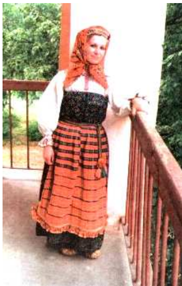
Комплекс праздничной домо- тканой одежды северных коми- пермяков начала XX века

тивным контактам с булгарами познакомились с технологией гончарного производства, секретами обработки железа, техникой зерни и скани. После разгрома Волжской Булгарии коми-пермяцкие земли оказались в составе Золотой Орды. За влияние на Пермь Великую и возможность собирать дань боролись также новгородцы и Московское княжество. Москва одержала верх в этой борьбе, в результате на территорию Прикамья начинает активно проникать русское население. Пермь Великая передается под управление князю